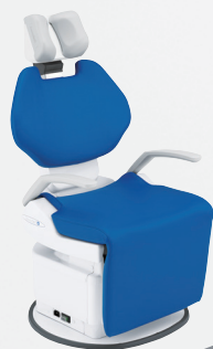
眼科用手術台 メプロ4J