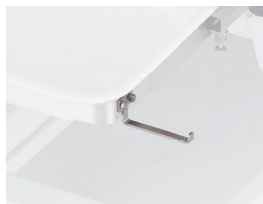
クスコ掛け ※クスコ掛けの取り付けには、汚水トレイ (CR-LPR-XT)が必要です。