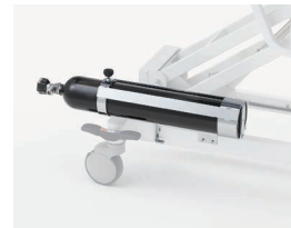
CR-LPR-BH 酸素ボンベホルダー (500L細型用)