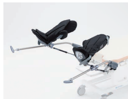
DR-OPTM-KTEK KTEK3100スターラップ ※クランプ、カートは別売です。