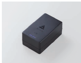
DR-070CHBP3 予備バッテリーパック ※充電器は含みません