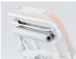
CR-LPR-PH/DG-OPT-R35 ロールシートホルダー /ロールシート