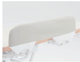
EB-BFT-SC サイドフェンスカバー