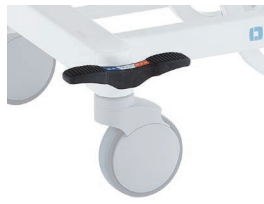
追加キャストロックペダル