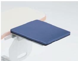
DR-OPTM-SIBK/SIAM 透視用上肢台小型M ※クッションなしタイプもご用意しています。 (DR-OPTM-SIA/SIB)