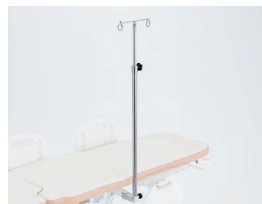
CR-LPR-DC/CR-LPR-DC-BK 中央側イルリガトル架(取付ブラ ケット1個付)/追加ブラケット