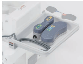
CR-LPR-FK フットスイッチ(小物トレイ付)